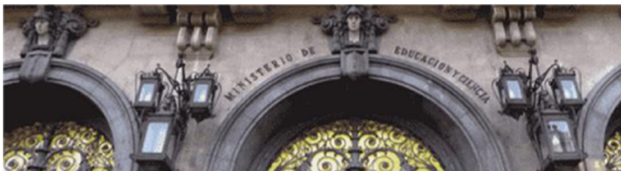
Fig. 33: Ministerio de Educación y Formación Profesional, calle Alcalá, Madrid

La educación es un derecho de los ciudadanos; es obligatoria y gratuita (excepto libros y materiales educativos) desde los 6 hasta los 16 años, lo que se llama educación básica española .