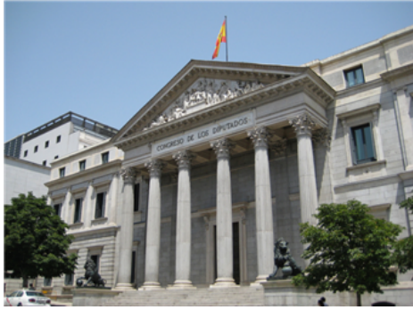
Fig. 6: Congreso de los Diputados.

El Congreso de los Diputados puede tener entre 300 y 400 diputados; en la actualidad está compuesto por 350 diputados. El Senado, también puede variar en el número de senadores que lo componen; en la actualidad está compuesto por 266 senadores. A cada provincia le corresponden cuatro senadores como máximo. Ceuta y Melilla solo eligen a dos senadores cada una de ellas. Los demás senadores son elegidos por los parlamentos autonómicos.