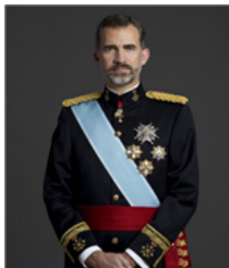
Fig. 4: Felipe VI, Rey de España

los miembros del Gobierno, a propuesta de su presidente, y tiene el mando supremo de las Fuerzas Armadas de España.