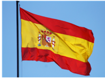
Fig. 2: Bandera de España

La bandera de España tiene tres franjas (roja, amarilla y roja): cada comunidad autónoma tiene su propia bandera y debe utilizarla junto a la española en sus edificios públicos y en sus actos oficiales.