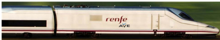
Fig. 46: AVE, tren de alta velocidad española