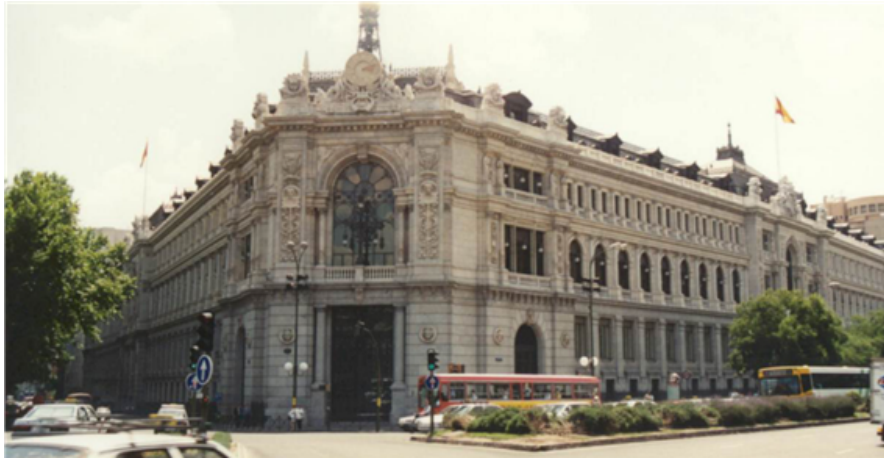
Fig. 48: Banco de España

Tres marcas españolas están entre las cien más valiosas del mundo: Movistar, Grupo Santander y Inditex.