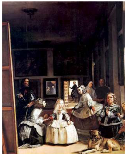
Fig. 19: Las meninas , de Velázquez.

España tiene un rico patrimonio. La UNESCO ha reconocido 47 bienes españoles como Patrimonio de la Humanidad, colocando a España en el tercer país con más bienes reconocidos, por detrás de Italia (54) y China (53).