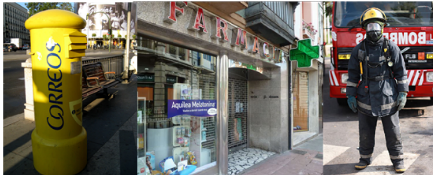
Fig. 41: Imágenes de un buzón de Correos, de una farmacia y de un bombero.

En las ciudades hay zonas de recreo y de descanso , como parques, jardines o instalaciones deportivas. En estos lugares de actividades de ocio, al aire libre, hay unas normas: