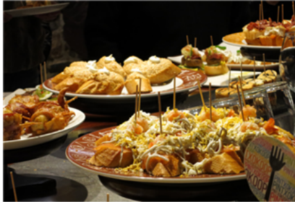
Fig. 31: Barra con pinchos en el País Vasco

En los establecimientos públicos (bares y restaurantes), una persona puede elegir una ración; un plato combinado, en el que hay ensalada, patatas fritas y carne, pescado o huevos; un menú del día de tres platos entre una selección fija, con pan, bebida y postre; o comer a la carta (el cliente elige cualquier plato de la carta). En cada caso el precio y la presentación varían.