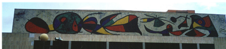
Fig. 21: Mural del Palacio de Congresos de Madrid. Joan Miró.

Además de los museos nacionales del Prado y Reina Sofía, hay otros muy conocidos internacionalmente: el Museo Picasso, en Barcelona; el Museo Thyssen-Bornemisza, en Madrid, y el Museo Guggenheim de Bilbao.