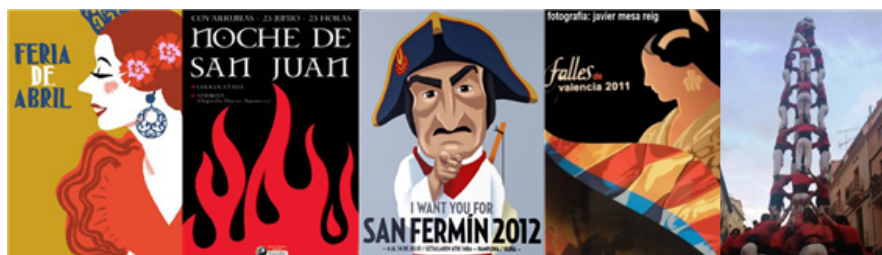
Fig. 25: carteles de fiestas tradicionales de España de repercusión internacional

Por otro lado, el toro o corridas de toros es un espectáculo que nació en el siglo XII. Se trata de la fiesta en la que se lidian toros bravos a pie o a caballo en un lugar denominado «plaza de toros». También se practica el toro en Portugal, en el sur de Francia y en diversos países de Hispanoamérica como Colombia, Costa Rica, Ecuador o México.