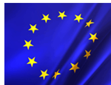
Fig. 5: Bandera de la Unión Europea.

España también forma parte de otras organizaciones internacionales, como la Organización de las Naciones Unidas (ONU); el Consejo de Europa (CE); la Organización del Tratado del Atlántico Norte (OTAN); la Organización para la Cooperación y el Desarrollo Económico (OCDE); la Organización para la Seguridad y la Cooperación en Europa (OSCE). Un lugar especial en las relaciones internacionales de España lo ocupa la Comunidad Iberoamericana de Naciones.