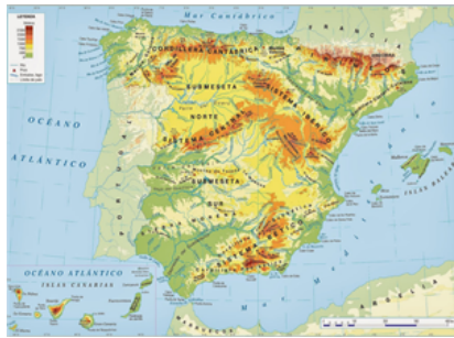
Fig. 14: Mapa físico de España.

• Ríos: los ríos más importantes de España que desembocan en el océano Atlántico son: Miño, Duero, Tajo, Guadiana y Guadalquivir. En el mar Mediterráneo desemboca el río Ebro, el más largo de España, y otros como Júcar, Segura y Turia.