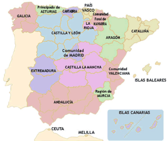
Fig. 16: Mapa político de las comunidades autónomas de España.

En el mapa político de España, se puede observar la división de España en comunidades y ciudades autónomas.